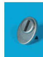
Osłona przeciwpyłowa zamka